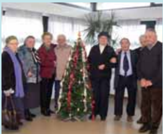
Al Centro Diurno per la Terza Età S. Pertini ha preso avvio il

Progetto Siamo Insieme. Gli obiettivi specifici del progetto sono il miglioramento del clima relazionale tra gli anziani ed il potenziamento delle loro abilità residue, attraverso attività settimanali gestite da un'educatrice con la collaborazione degli addetti all'assistenza e dell'assistente sociale dell'area anziani dell'Istituzione Vivavoce.