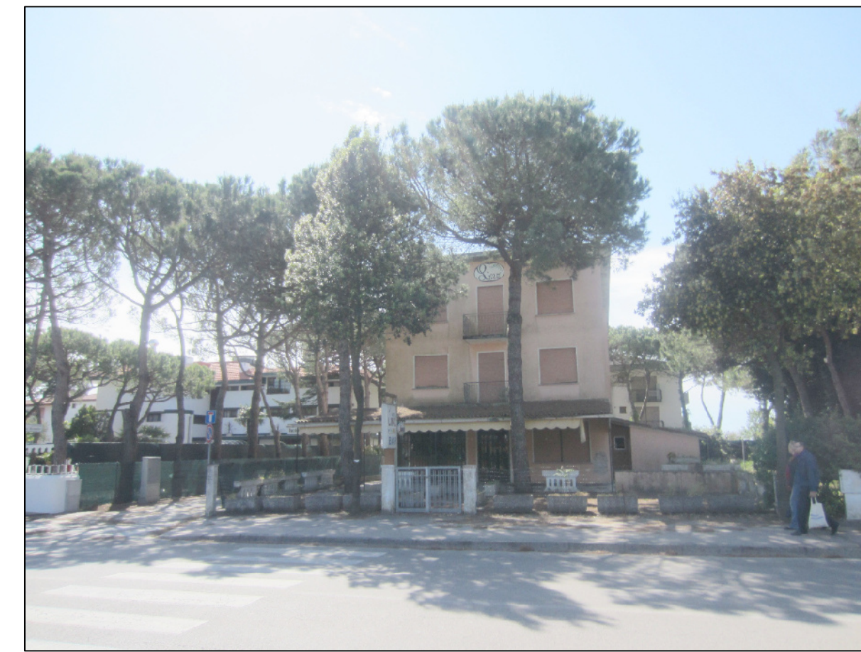
Foto 1 - Vista frontale da viale Oriente