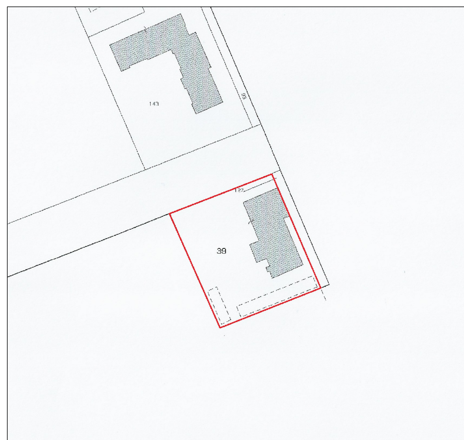
ESTRATTO DI MAPPA Scala 1:2000 COMUNE DI JESOLO (VE) FG. 97, MAPP. 39