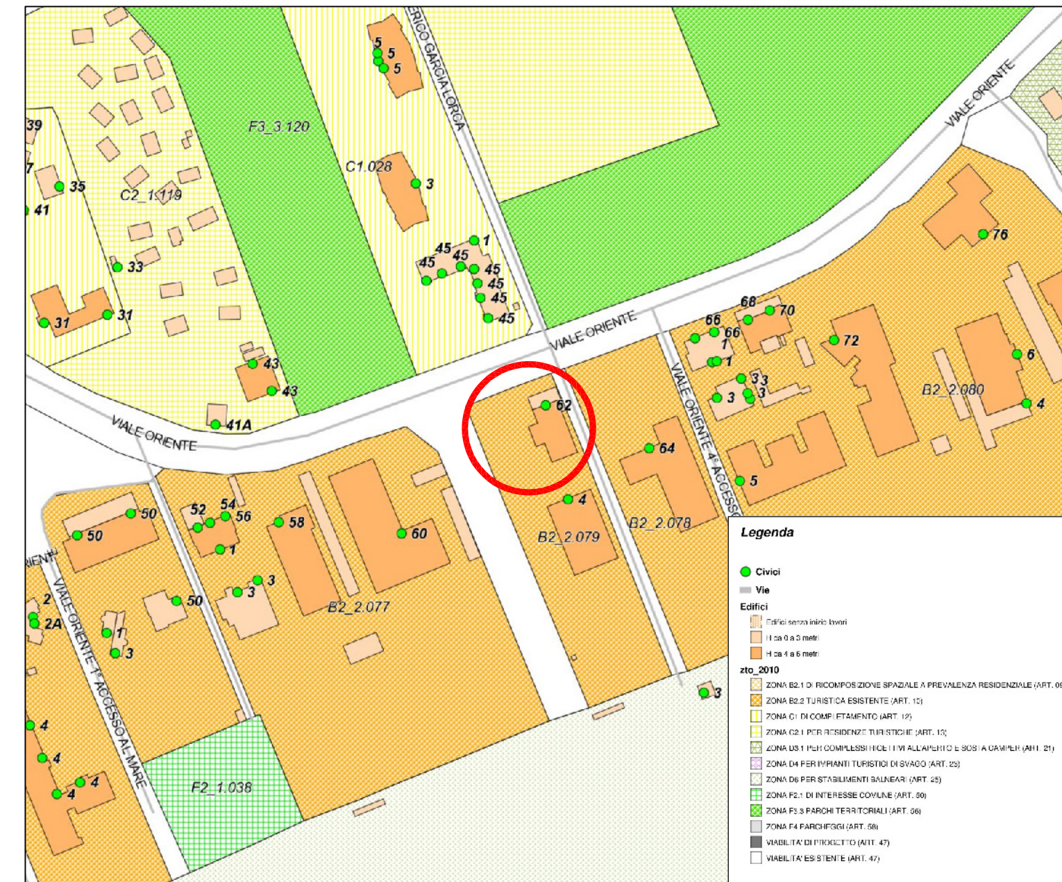
ESTRATTO DI P.R.G.C. - ZONA TURISTICA ESISTENTE "B2.2" Scala 1:2.000