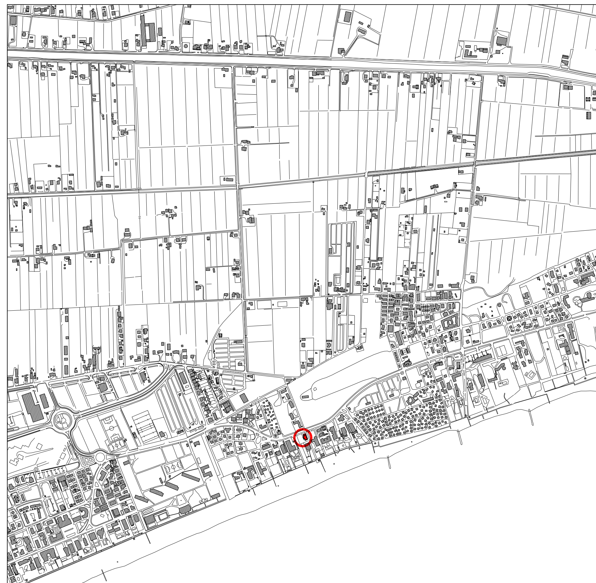
C.T.R. Scala 1:10.000