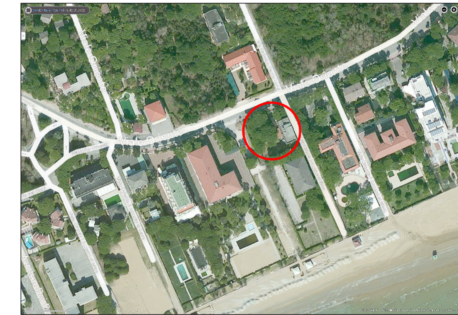
ORTOFOTO Scala 1:2.000