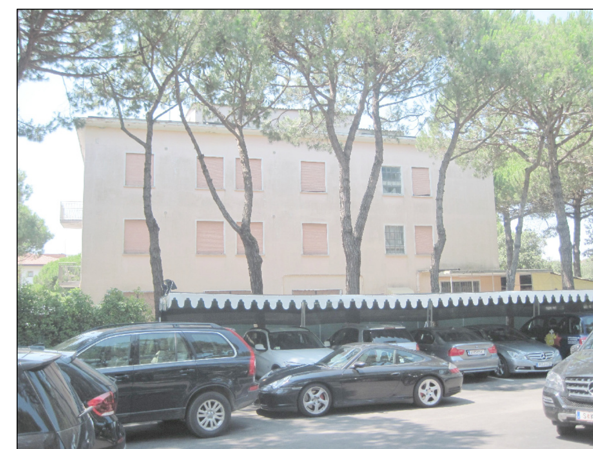
Foto 3 - Vista laterale est