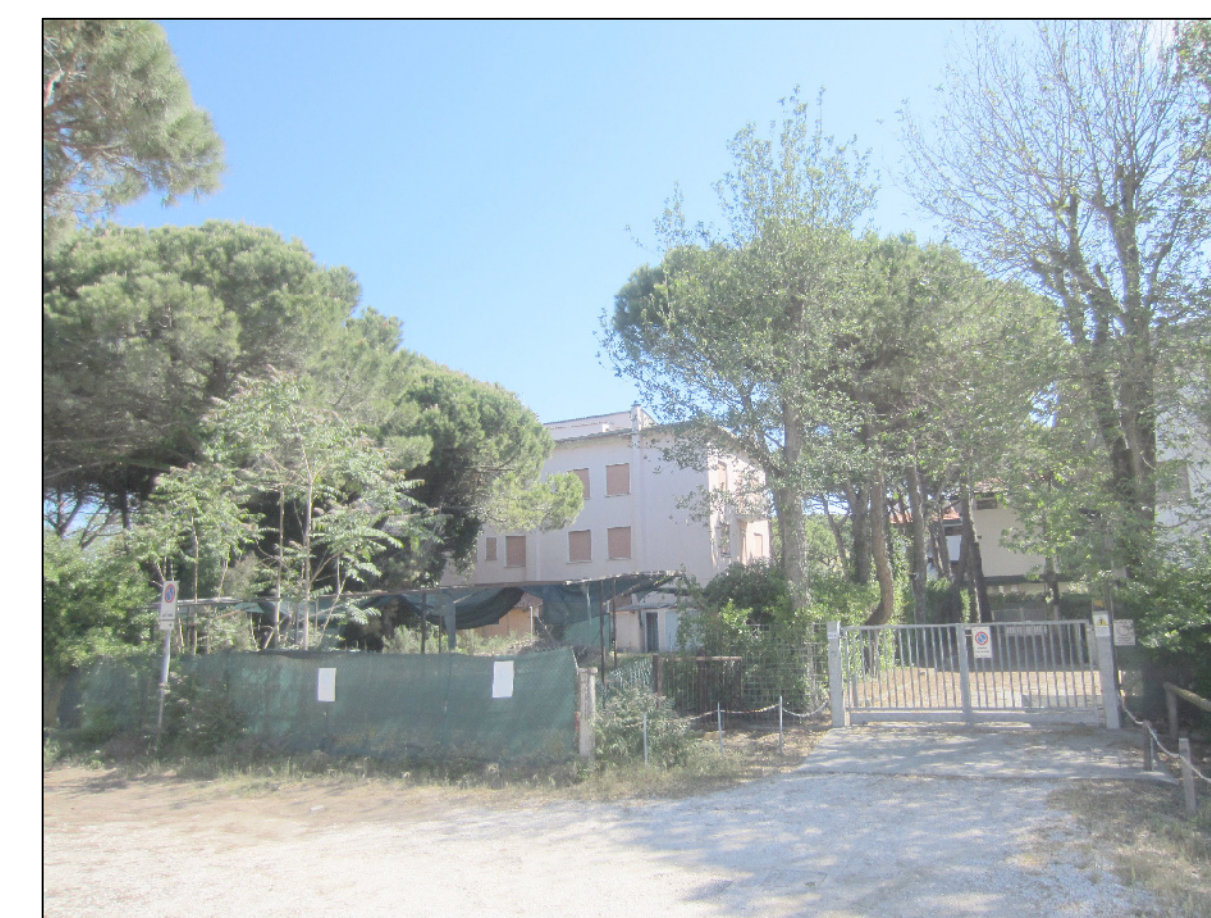
Foto 6 - Vista laterale ovest