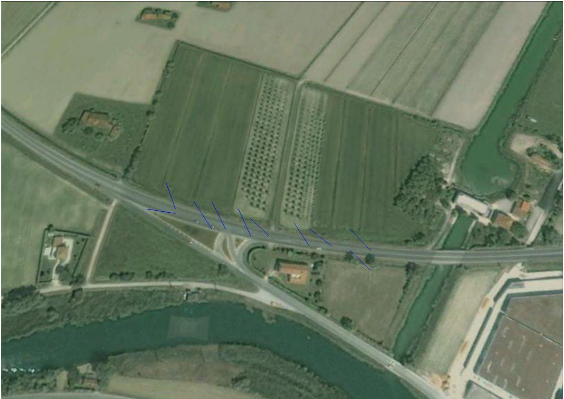
INDICAZIONE PUNTI DI RIPRESA FOTOGRAFICA