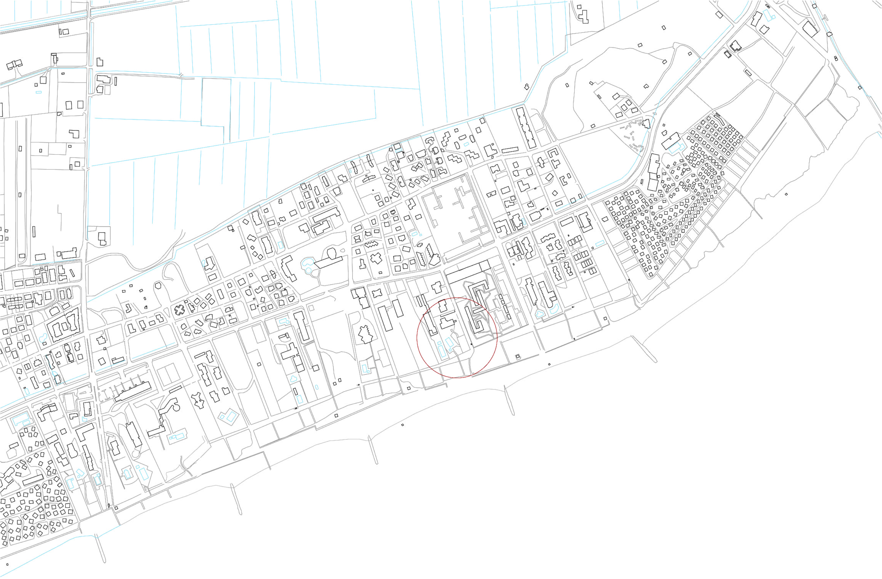
estratto C.T.R. - scala 1:5000