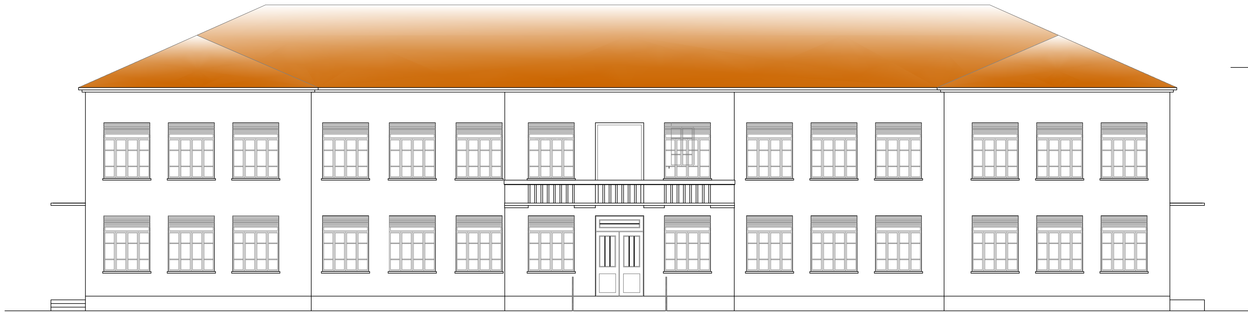
PROSPETTO SUD - VIA BAFILE