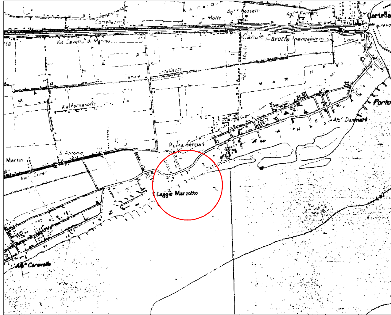
Corografia scala 1/25000