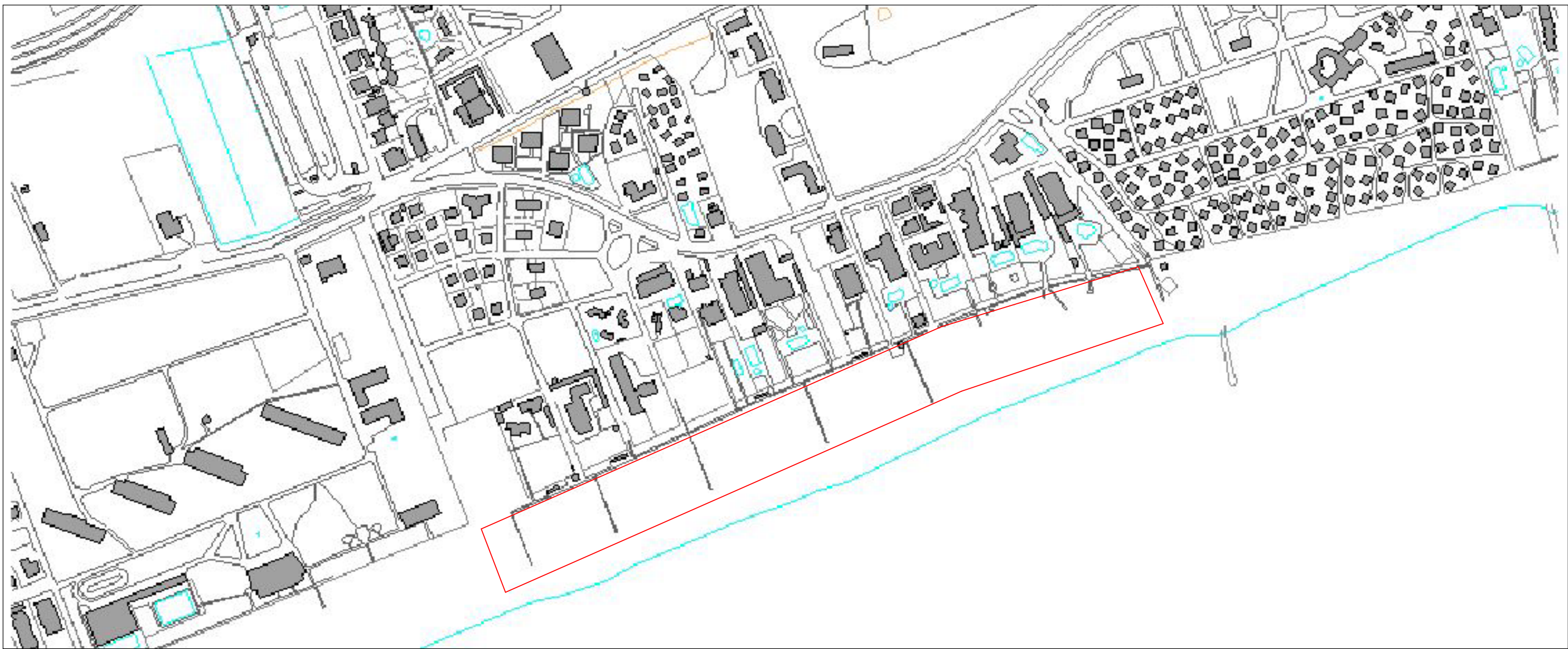
Stralcio C.T.R. scala 1/5000