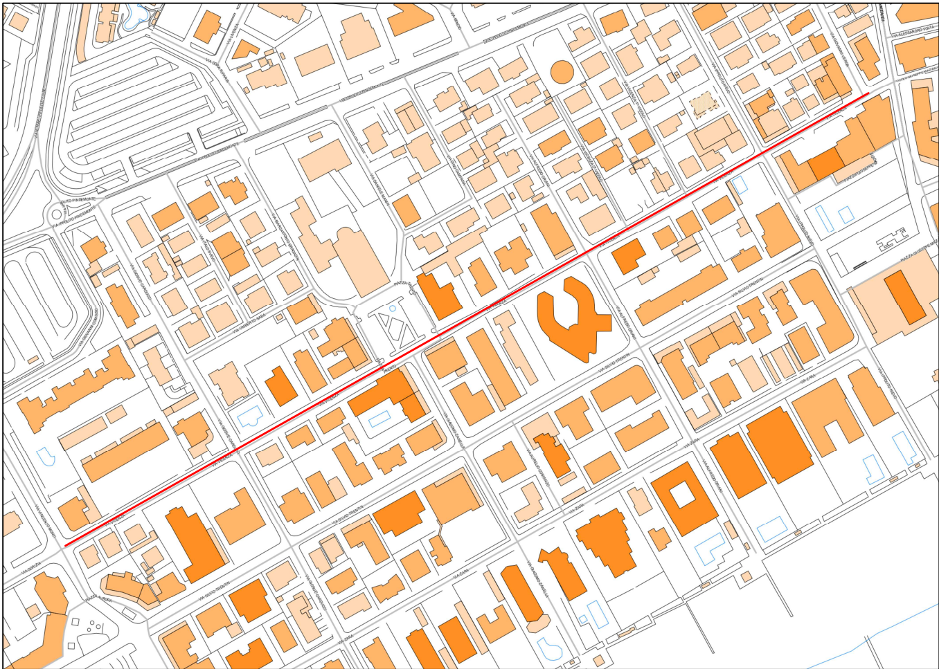
ESTRATTO DI C.T.R.

Il Comune di Jesolo ha un Sistema Qualità certificato in accordo alla norma UNI EN ISO 9002 per i seguenti uffici: Commercio, Tributi, Pianificazione e Attività Edilizia