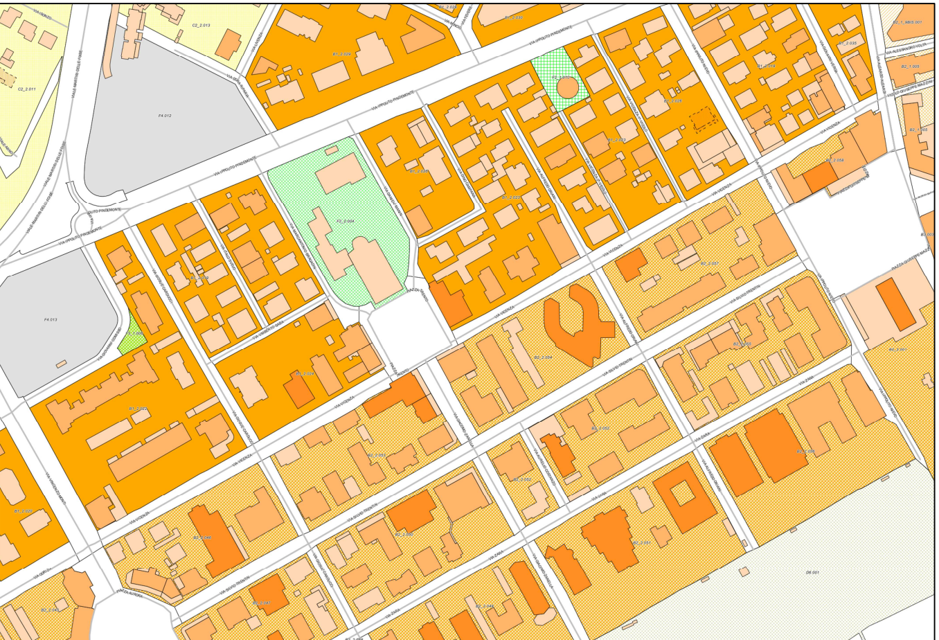
ESTRATTO DI PRGC