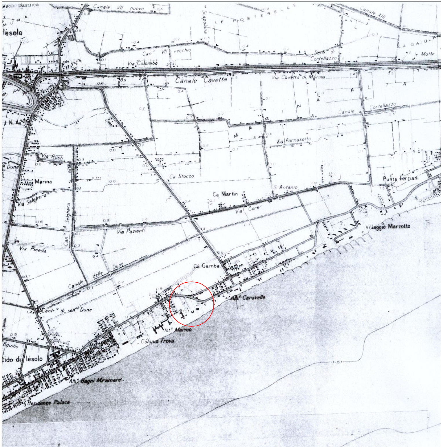
STRALCIO COROGRAFIA scala 1/25000