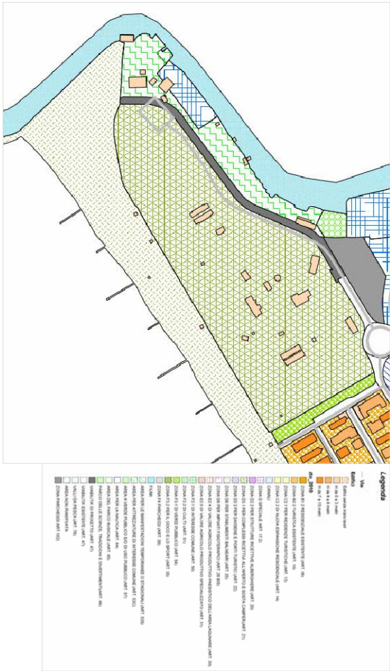
ESTRATTO PRG VIGENTE SCALA 1:5000