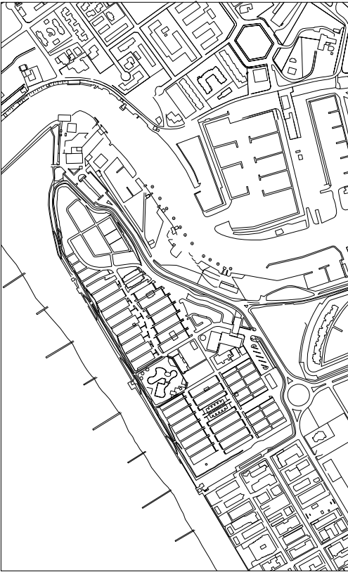
ESTRATTO DI CARTA TECNICA REGIONALE SCALA 1:5000