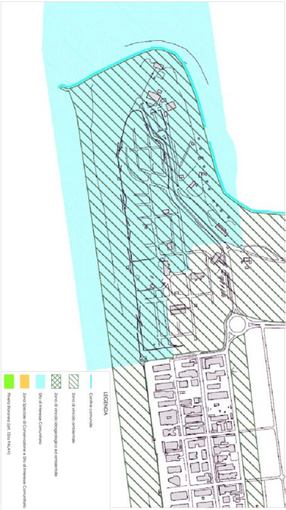
ESTRATTO DI PIANO DELL'ARENILE – TAV. 2.1.2 VINCOLI AMBIENTALI SCALA 1:5000