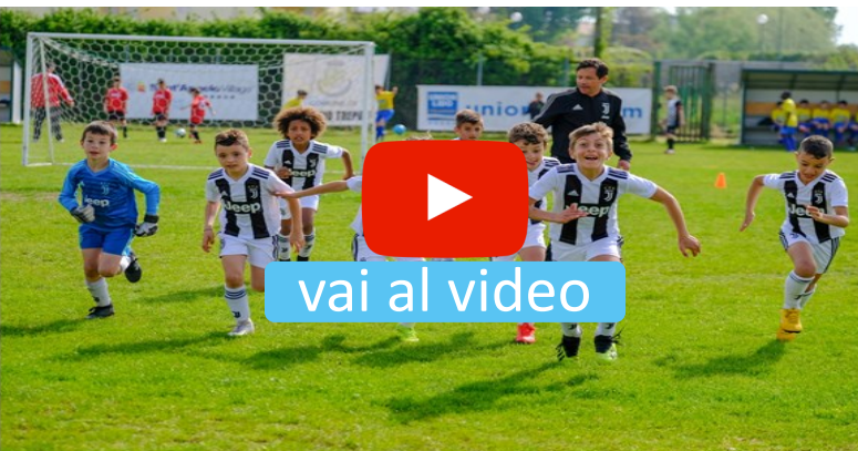
FOTO E VIDEO

Scopri Venezia nel tempo libero. Contattaci per conoscere le nostre proposte turistiche.