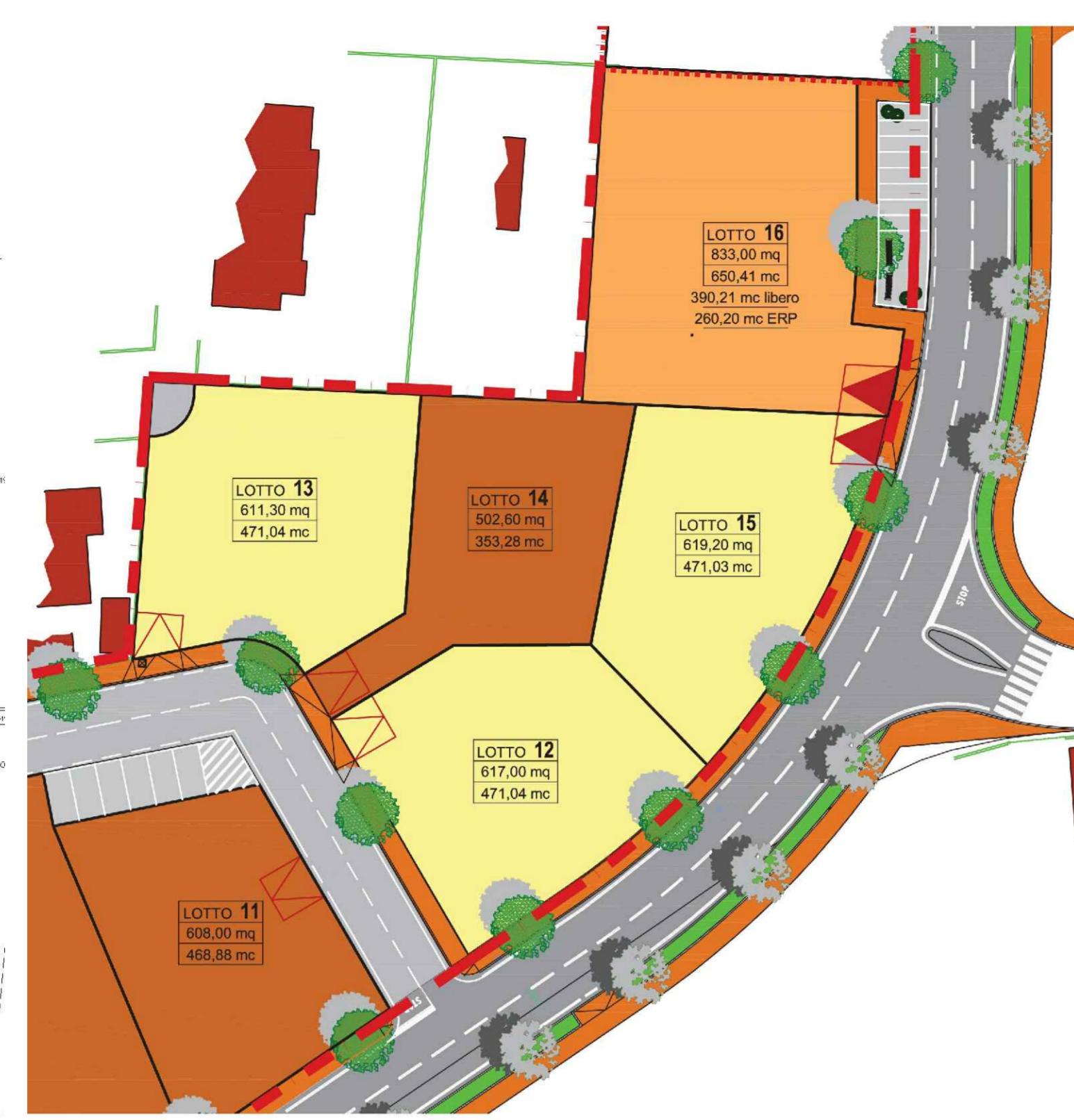
Progetto approvato - Individuazione ERP scala 1: 500