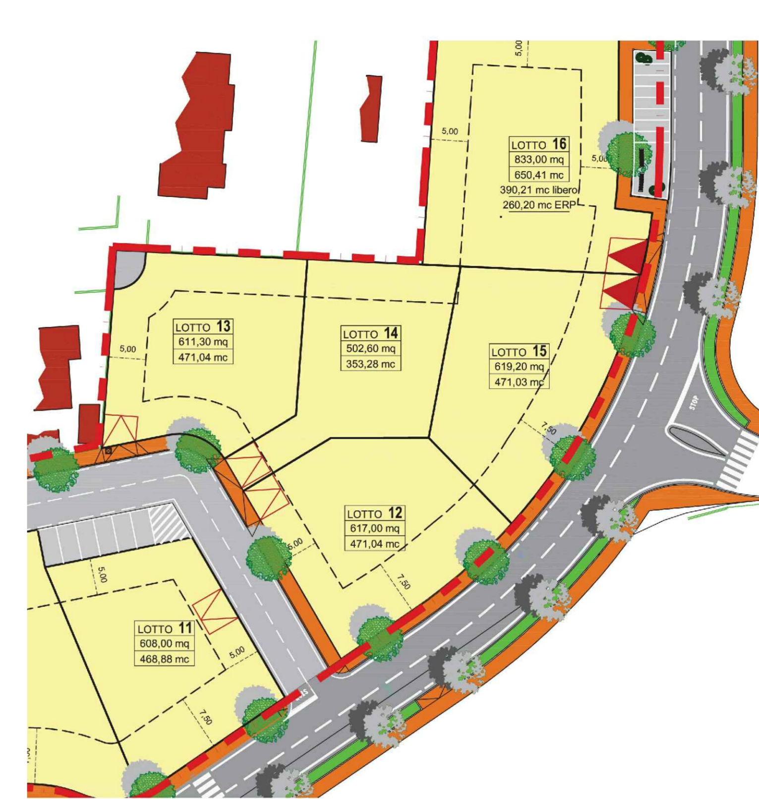
Progetto approvato - Carature lotti scala 1: 500