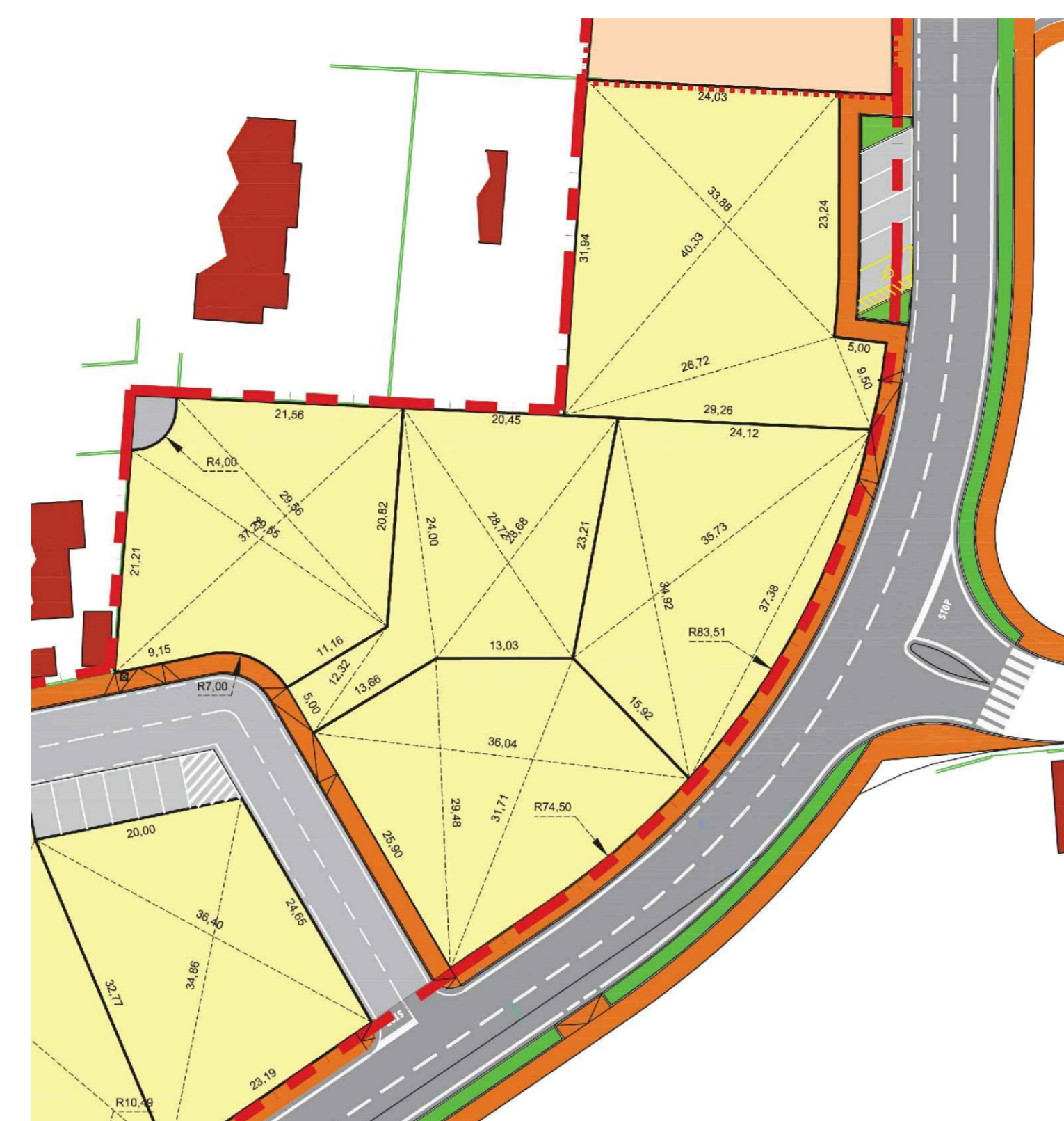
Progetto approvato - Dimensione lotti scala 1: 500