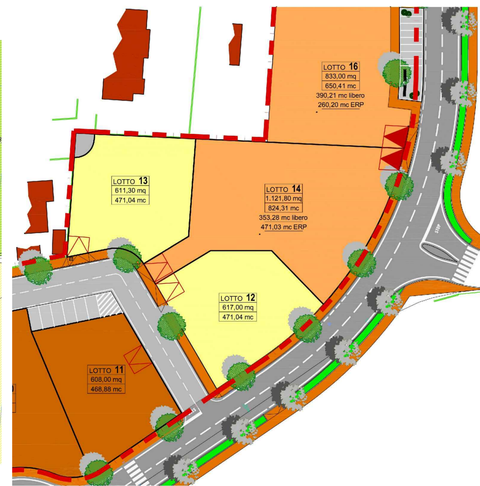
Variante - Individuazione ERP scala 1: 500