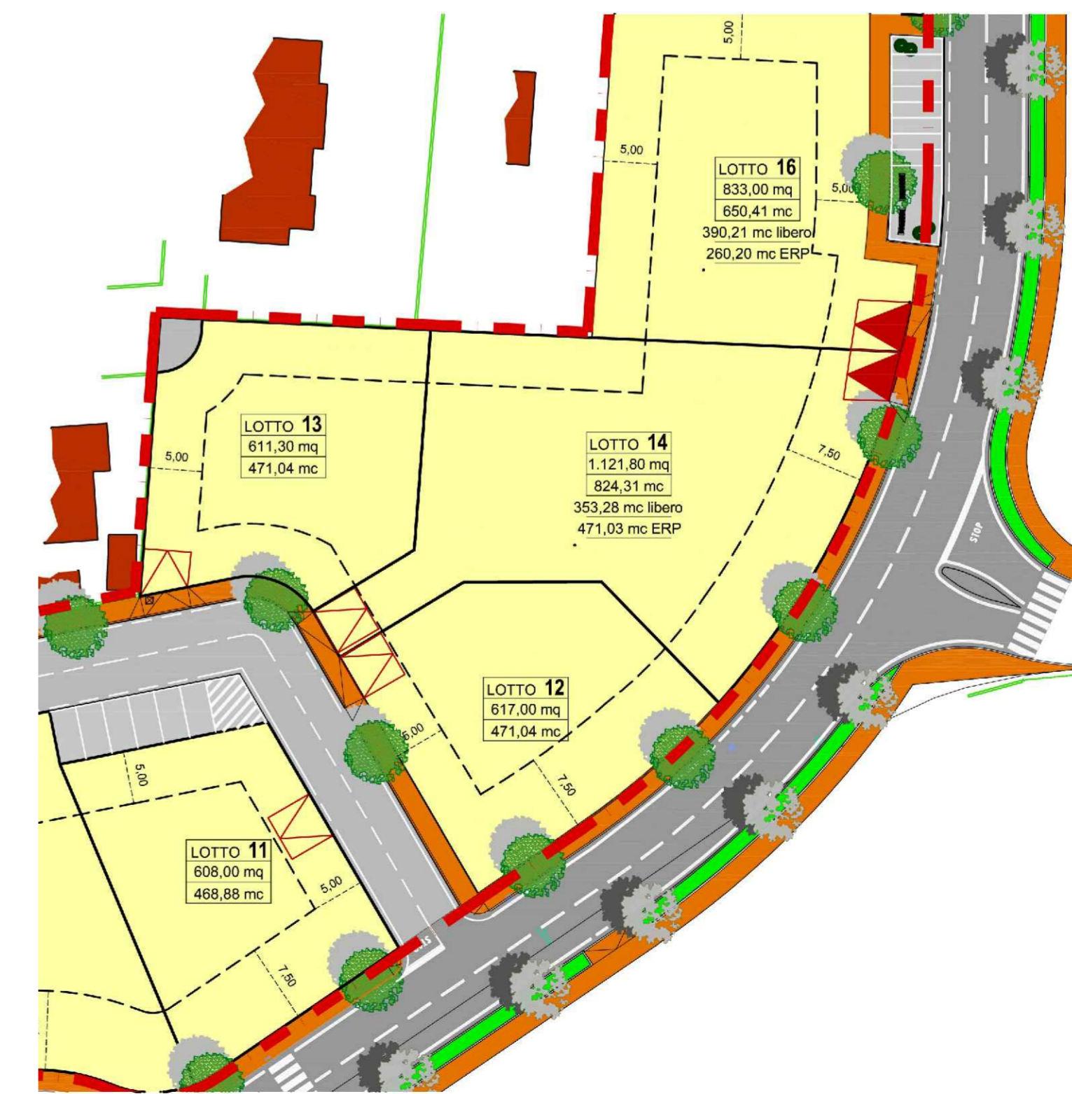
Variante - Carature lotti scala 1: 500