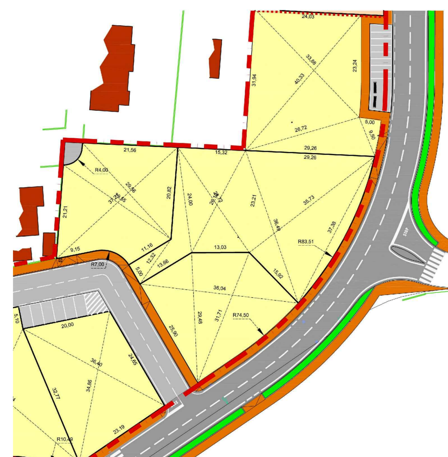
Variante - Dimensione lotti scala 1: 500