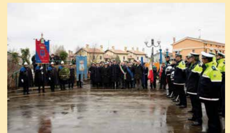
Cerimonia semplice nel rispetto delle norme per San Sebastiano, protettore della Polizia locale. Il tradizionale appuntamento è stata l'occasione per tracciare il bilancio sull'attività svolta nel corso del 2020, anno difficile per il Corpo segnato dall'emergenza sanitaria della COVID-19.