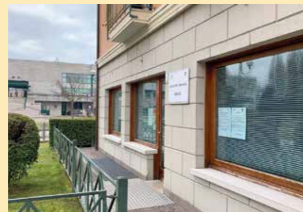
Importante riconferma per i lavoratori dei comuni di Jesolo, Eraclea e Cavallino-Treporti. Il Centro per l'impiego di via Sant'Antonio, di fronte al municipio di Jesolo continuerà ad erogare i servizi fino al 2027. L'amministrazione jesolana ha infatti approvato lo schema di convenzione per il rinnovo del contratto di locazione dell'immobile utilizzato da ormai vent'anni.