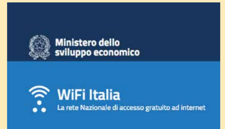
Jesolo aderisce al progetto "Piazza wi-fi Italia" sviluppato dal Ministero dello Sviluppo Economico con l'obiettivo di creare una rete nazionale di punti di accesso wifi gratuiti. Un vantaggio anche per i cittadini, che tramite un'unica app possono così accedere in tutta Italia a tutte le reti disponibili. Con l'ingresso nel progetto del MiSE la città di Jesolo beneficerà anche dell'installazione di 12 nuovi access point previsti nella frazione di Cortellazzo, oggi caratterizzata da una elevata densità abitativa e scarsa copertura internet.