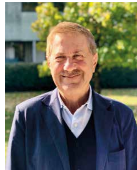
il Sindaco Valerio Zoggia

“Dopo un anno di grande difficoltà e di sofferenza, ora iniziamo a vedere davanti a noi un cambio di rotta, un’inversione di tendenza della pandemia che in questi 12 mesi ha cambiato le nostre vite. Il Paese e il mondo intero hanno fatto passi avanti fondamentali per contrastare l’avanzata del virus, per ridurre il più possibile gli effetti sulla salute e preservare delle vite. A quel senso di impotenza che ci ha pervasi tra il febbraio e marzo 2020 quando per proteggerci ci siamo dovuti isolare nelle nostre case, oggi ci stiamo dirigendo a passi più rapidi verso una migliore convivenza con il virus. Arrivare fin qui non è stato facile, lungo il tragitto abbiamo dovuto dire addio a persone a noi care e ci troviamo a dover fare i conti con gli effetti economici sociali e psicologici che le restrizioni e l’isolamento hanno generato.