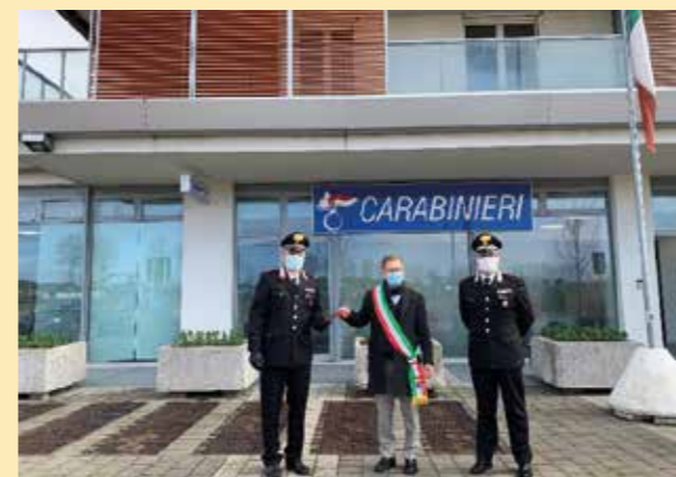
Visita ai locali adibiti a sede temporanea dell'Arma dei Carabinieri al Lido di Jesolo durante i lavori di ristrutturazione della stazione del centro storico. Il sindaco ha preso visione dei locali e sottolineato l'impegno dell'amministrazione nei confronti delle Forze dell'ordine.