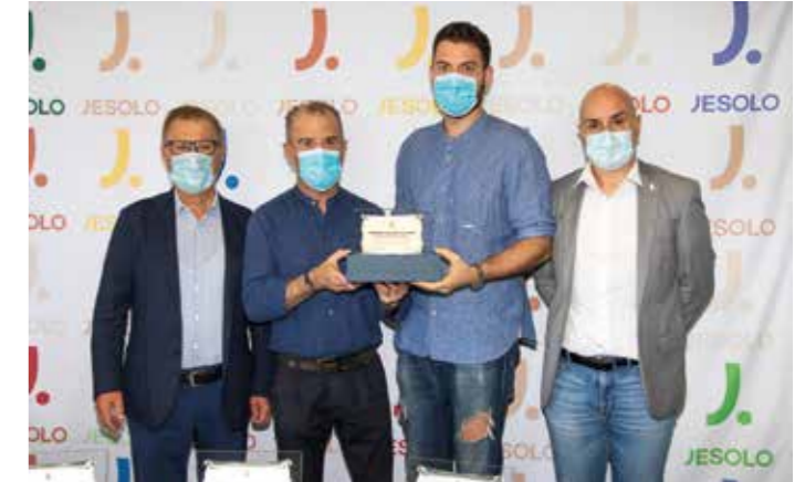
Ristorante Pizzeria Al Torcio

L'amministrazione comunale che ha adottato questa decisione per favorire la ripartenza e la ripresa delle attività ha voluto anche premiare i migliori allestimenti.