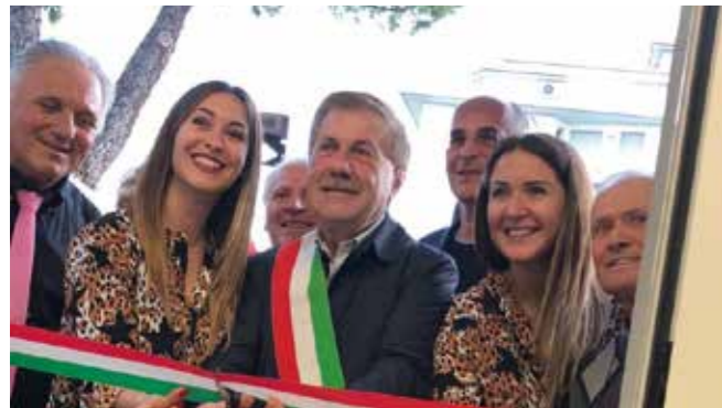
Uliana Beauty Lab è il nuovo centro per l'acconciatura e l'estetica inaugurato alla presenza del Sindaco.