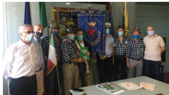
Ricevuta in comune una delegazione dell'ANA (Associazione Nazionale Alpini) Provinciale.