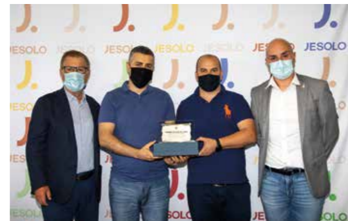
Ristorante Pizzeria L'Incontro da Roberto