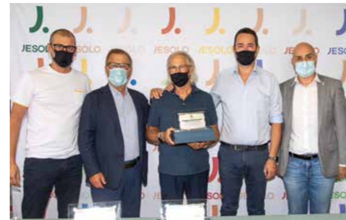
Ristorante Pizzeria Milleluci