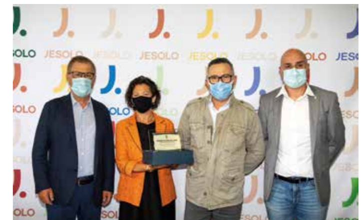
Ristorante Pizzeria Piave