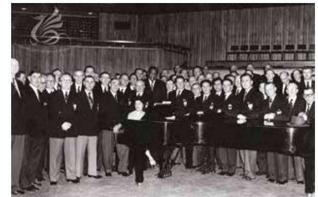
Choir with Paul Robeson 1960

Cwmbach Male Choir is delighted to be making its debut in Croatia in May 2016